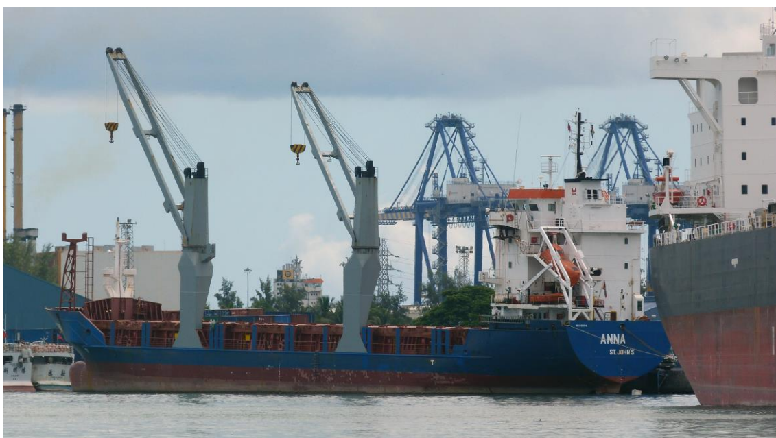
Named ANNA Port Louis (Mauritius) 22/03/2018

2014: Renamed ANNA (mgrs: Lubeca Marine (Germany) GmbH & Co KG)