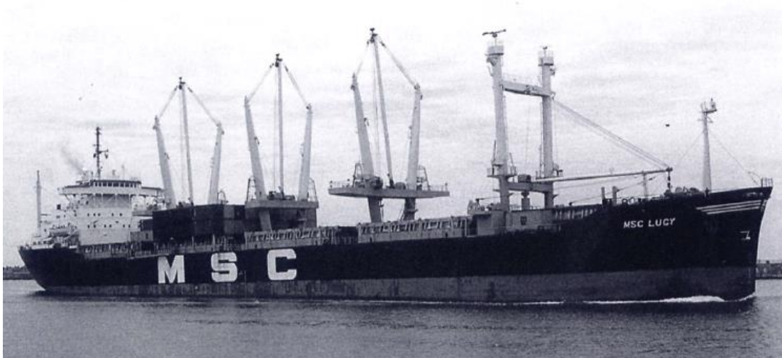
Named MSC LUCY © Detlefsen: Unter fremder Flagge - Schicksale deutscher Frachter